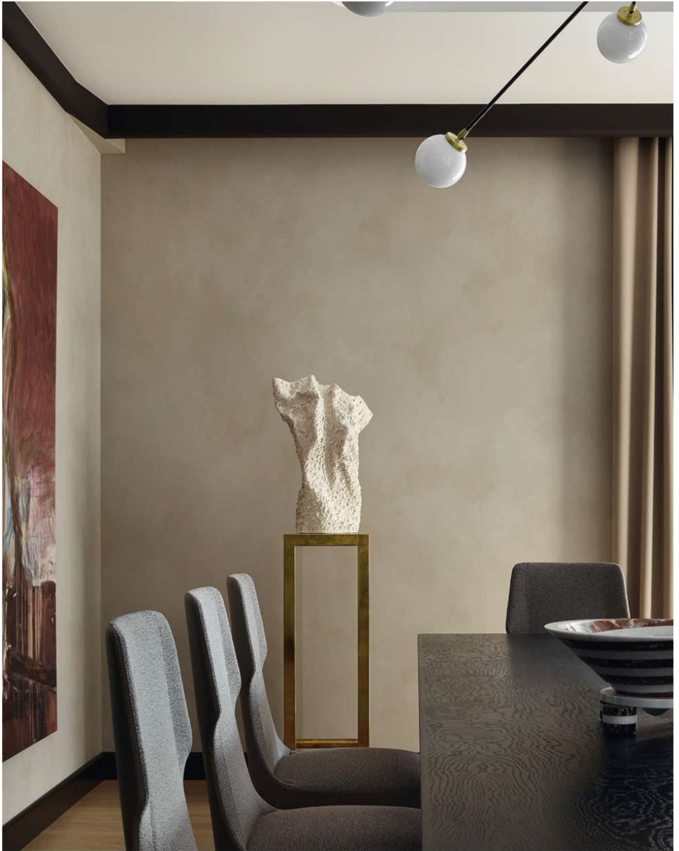
Фрагмент столовой. На этой фотографии хорошо видна живописная покраска стен. Ваза на постаменте, все GK Concept.