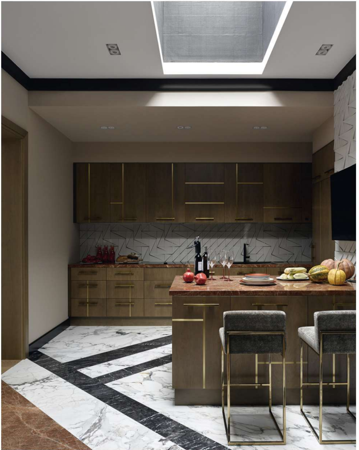
Кухня, “Мастерская краснодеревщиков Камо Мурадова”; пол из мрамора, Олег Соколов и Magma Stone; плитка, Mambo; барные стулья, Laskasas, в обивке, Nobilis.