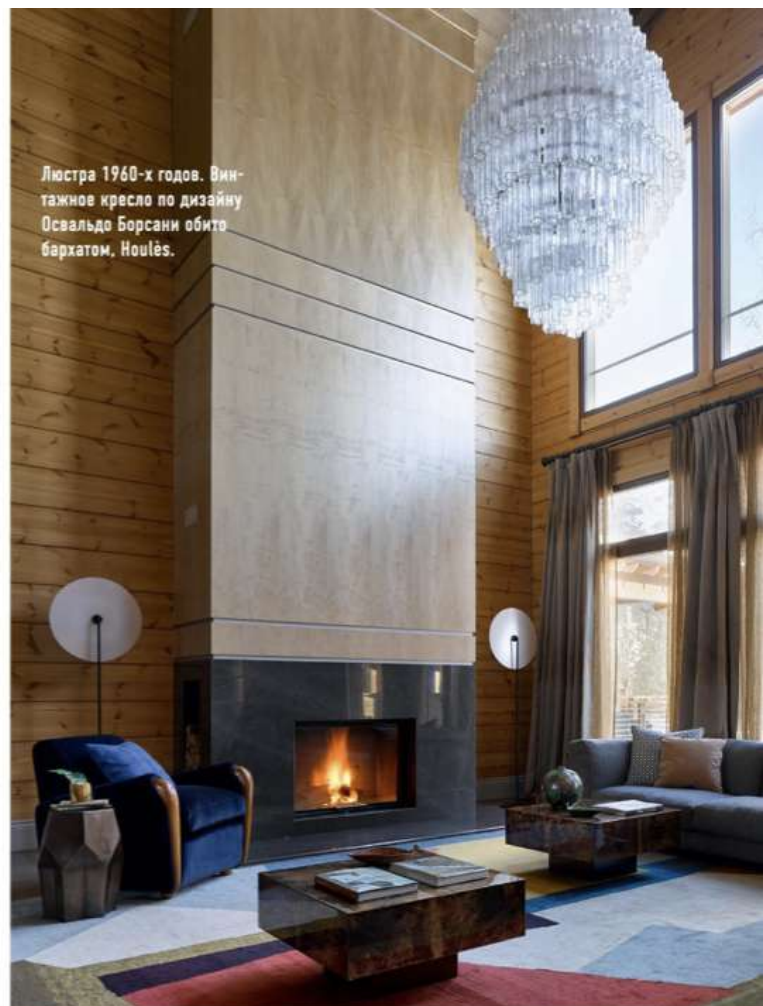
Люстра 1960-х годов. Винтажное кресло по дизайну Освальдо Борсани обито бархатом, Houllès.