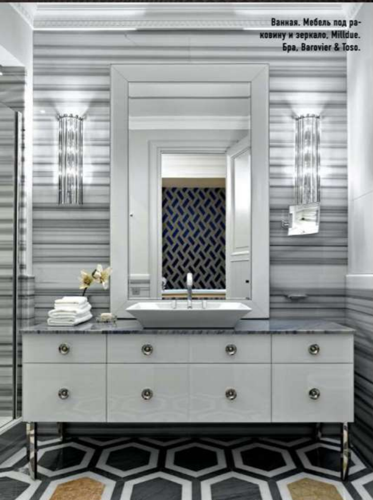
Ванная. Мебель под раковину и зеркало, Milldue. Бра, Barovier & Toso.